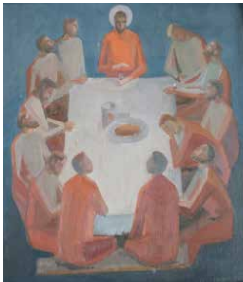
»Den sidste nadver« Alterbilledet i Udby kirke malet af Troels Trier, 1960