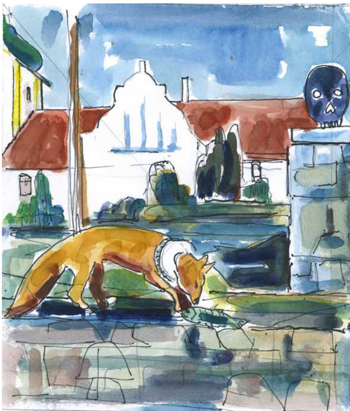
Akvarel af Allan Herrik februar 2022