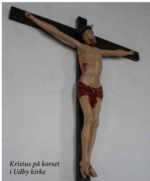
Kristus på korset i Udby kirke