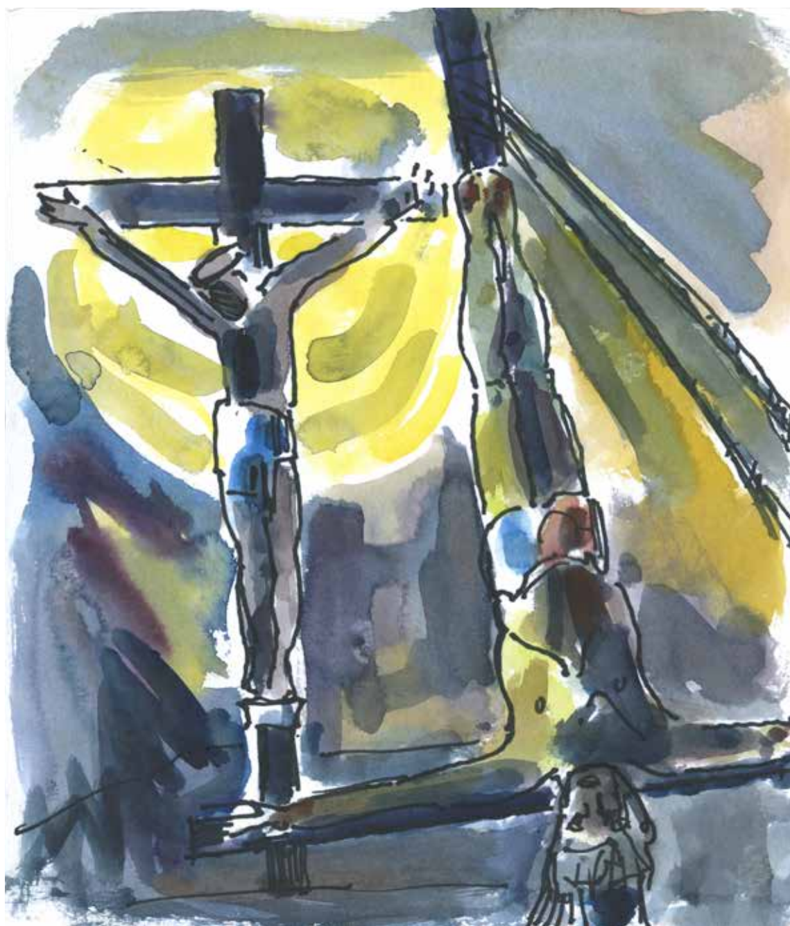
Akvarel af Allan Herrik februar 2026